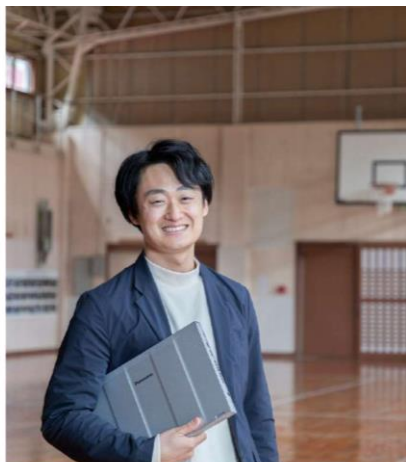
Re:ゼロから始める地方創生

趣味は広く浅く、旅行、野球、スノボ、ハンドボール、アニメ、DIY、音楽、ゲーム 最近猫を保護したため家事も仕事も手についていない