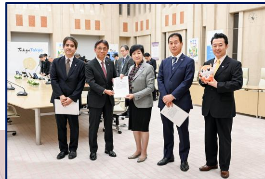
東京都小池都知事 政策提言（2025年11月）