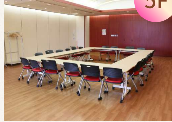
キャリア・ママ ホール