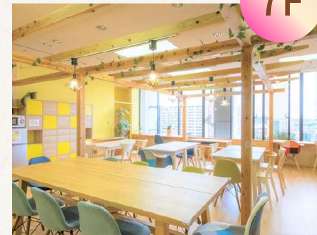
コワーキング CoCoプレイス&保育室