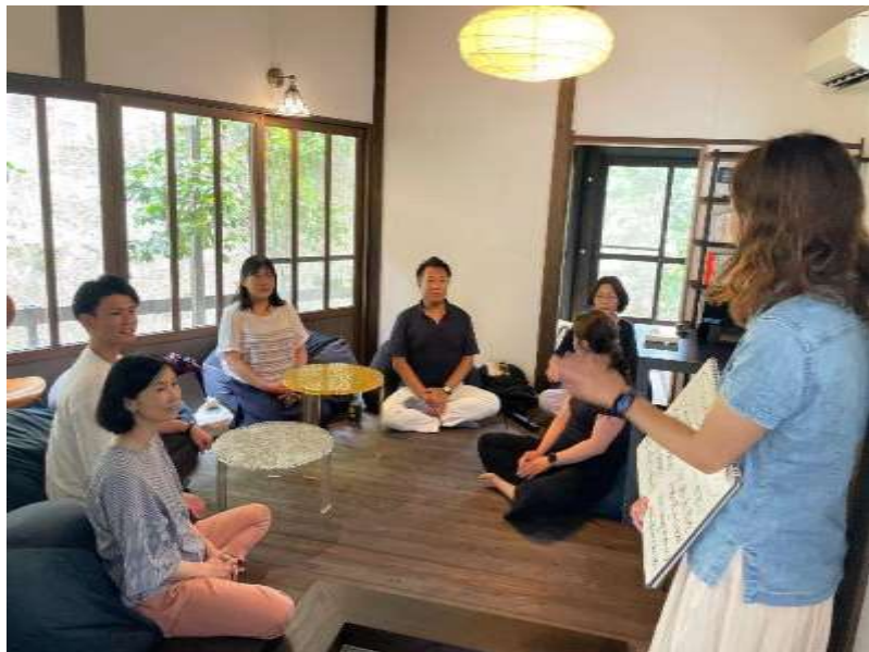
営業ミーティング前にマインドフルネス体験で 一体感と集中力を向上 (Think Space 鎌倉, 稲村ケ崎)

「鎌倉の古民家やお寺の境内など普段とは異なる環境に集まることにより お互いの距離感が近くなり、 チームのコミュニケーションを促進することが出来た 」