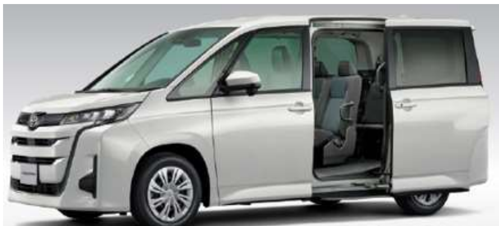
運行車両：新型ノア・ウェルジョインHV