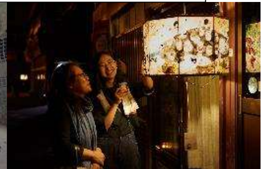
肘折さんげさんげ7 (1/7)