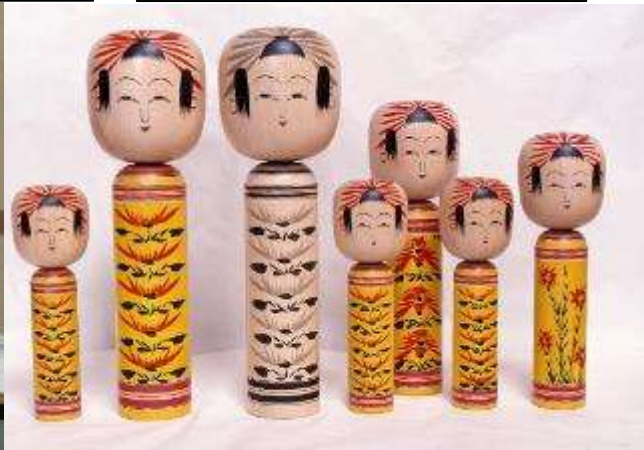
肘折系：肘折こけし