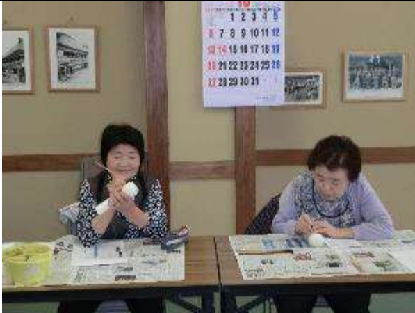
こけしの絵付け体験：肘折いでゆ館