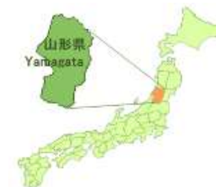
おいしい山形空港