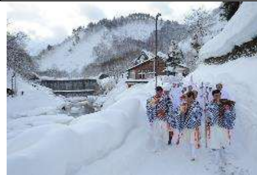
肘折さんげさんげ7 (1/7)