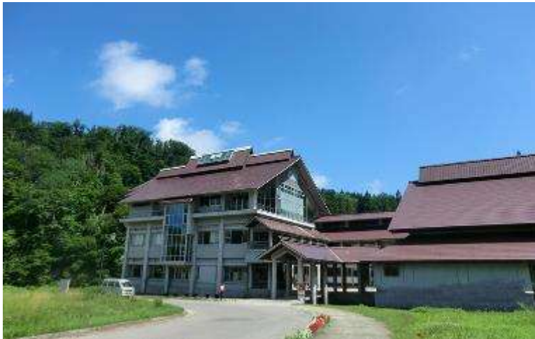
肘折いでゆ館全景