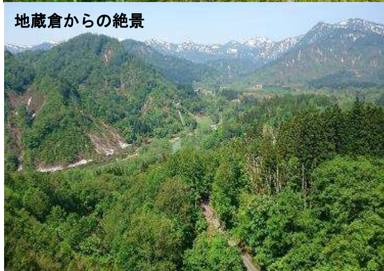
地藏倉からの絶景