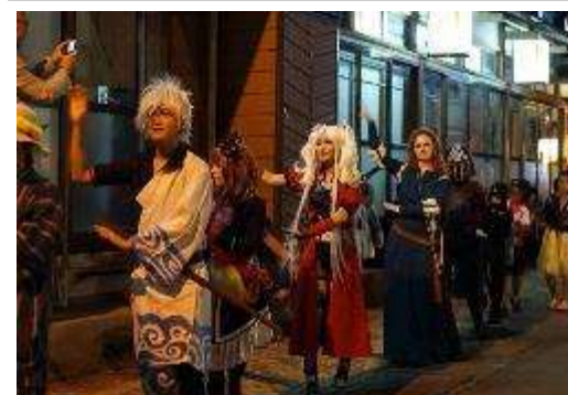
仮想コスプレ盆踊り (8/16)