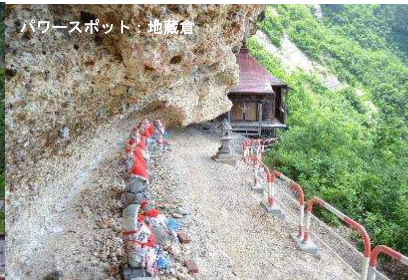
パワースポット：地藏倉