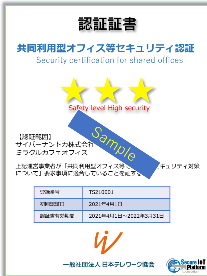
認証証書（日本語・英語各1通）