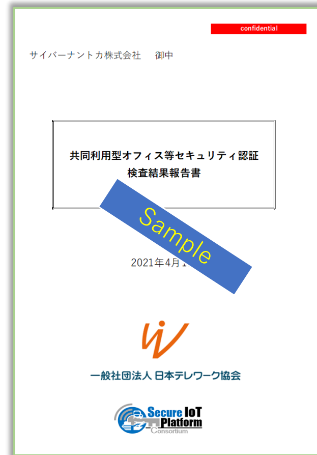
検査結果報告書（日本語PDFファイル1通）