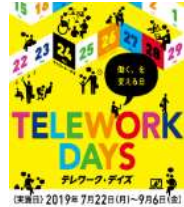
テレワーク・デイズ2019 ポスター