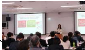
セミナー開催の様子