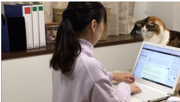
<自宅でテレワーク勤務している様子>