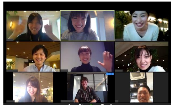
<WEB 会議を実施している様子>