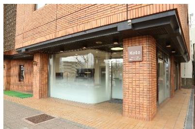
駒ヶ根テレワークオフィスの外観

子育てなどで就業時間に制約があり、一般的な就業が困難な市民にも働ける環境をつくるために、2017年3月に開設した駒ヶ根テレワークオフィス（通称：Koto）を、進出企業（株式会社クラウドワークス、株式会社ステラリンク）と共に運営。 <受賞歴> ●第18回テレワーク推進賞奨励賞 ●令和元年度情報通信月間総務大臣表彰