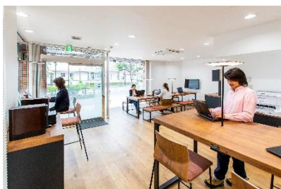
内観（1階テレワークセンター）