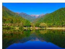
駒ヶ根高原（駒ヶ池）