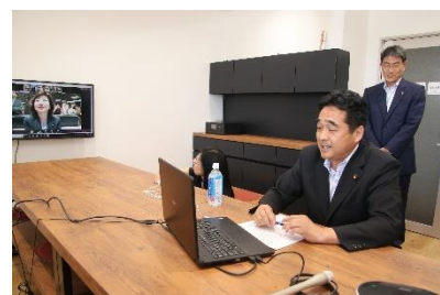
KotoでWeb会議をする総務副大臣

総務省、厚生労働省、経済産業省、国土交通省、内閣官房、内閣府が、東京都および関係団体と連携し、2017年より、2020年東京オリンピックの開会式にあたる7月24日を「テレワーク・デイ」と位置づけ展開している働き方改革の国民運動。昨年の「テレワーク・デイ」（2018年7月24日）には、Kotoに総務副大臣が来所し、東京の総務大臣とWeb会議を実施。