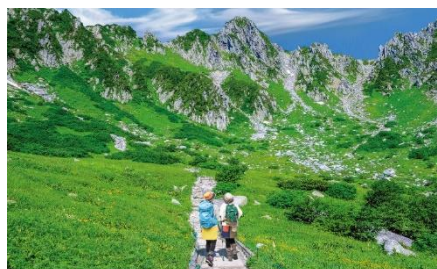
千畳敷カール（標高 2,612m）