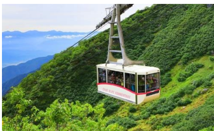
中央アルプス駒ヶ岳ロープウェイ