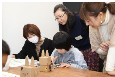
プログラミング教室