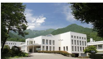
養命酒駒ヶ根工場

※ 期間中、駒ヶ根市ならではの体験（養命酒駒ヶ根工場の見学や JICA 駒ヶ根の視察）や、観光（駒ヶ根高原、早太郎温泉、光前寺など）もお楽しみいただけます。