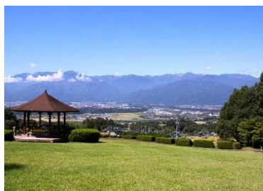
市内から眺める中央アルプスの山並み

中央・南アルプスの美しい景観、中央アルプス駒ヶ岳ロープウェイ・早太郎温泉などの観光資源に恵まれた長野県駒ヶ根市は、先進的に取り組んできたテレワーク事業 ※1 の発展と、関係人口 ※2 の拡大を目指して、ワーケーション ※3 事業に着手します。