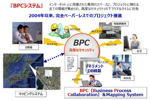
他社とのテレワークシステム（BPC）