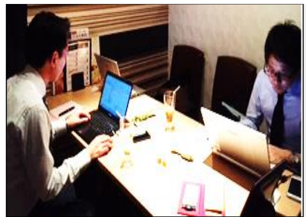
サテライトオフィスでの業務の様子