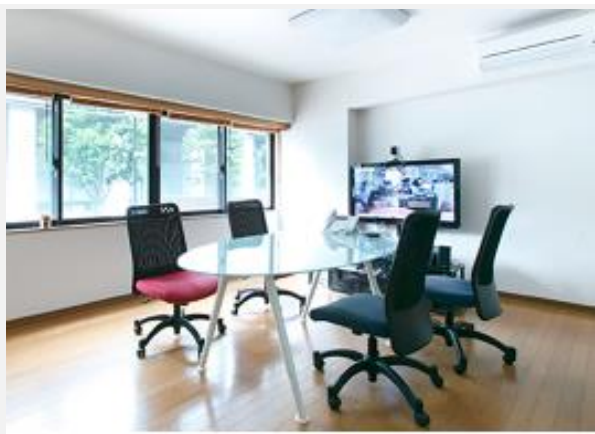
弊社東京オフィス

実施団体としては「テレワークデイズ期間中の東京オフィス完全閉鎖」に挑戦します。47日間という長い期間になりますので、郵便物、宅配便、代表電話、印刷物、来客など様々な課題をどう解決できるかがテーマです。また、応援団体としてはコミュニティ型ワークスペースのクラウド版を使って、お客様が自社の業務を行ったり、入居する他社とコラボレーションしたり、などをオンラインで体験していただく機会をサポートします。