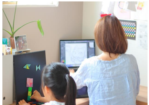
育児しながら在宅勤務をしている様子