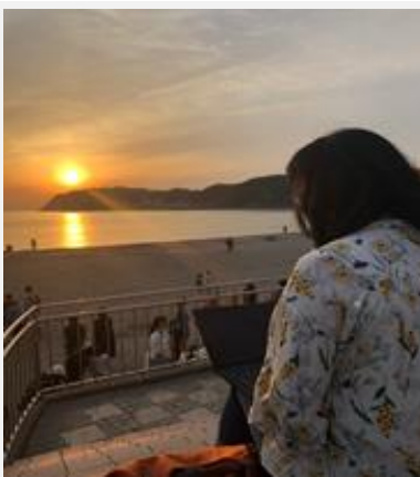
同僚の在宅勤務風景